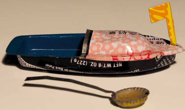
Knatterboot. Recyclingspielzeug aus Indien (MuPäd 164 a-b).