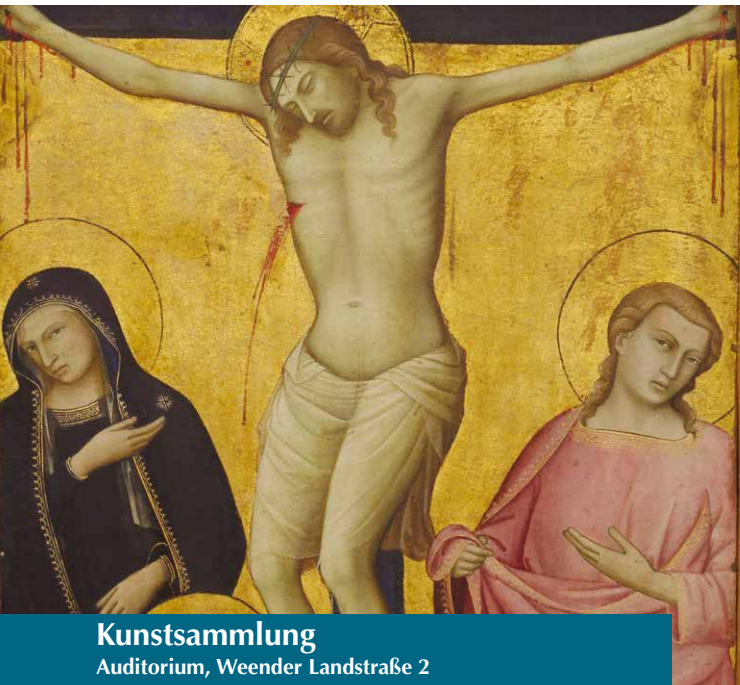
Kunstsammlung Auditorium, Weender Landstraße 2