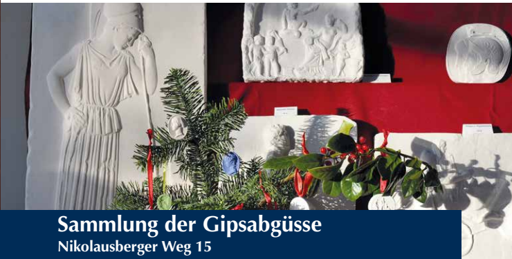
Sammlung der Gipsabgüsse Nikolausberger Weg 15