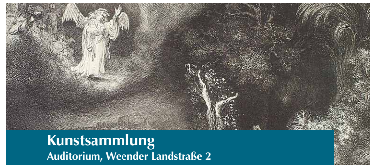
Kunstsammlung Auditorium, Weender Landstraße 2

15. Dezember, 11.00 – 16.00 Uhr Adventsbasar Weiße Weihnacht in der Sammlung der Gipsabgüsse