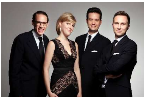
Doric Quartet

Joseph Haydn, Streichquartett D-Dur op.64,5 „Lerchen-Quartett“