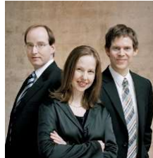
Hyperion Trio