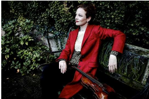
Carolin Widmann

Richard Strauss: Sonate für Violine und Klavier Es-Dur op.18