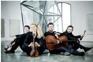
Pavel Haas Quartet

Johannes Brahms, Klavierquintett f-Moll op.34