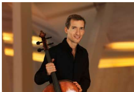
Stephan Koncz