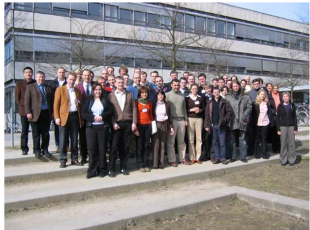
Die Teilnehmer des diesjährigen Workshops

und methodische Fragestellungen auf dem Gebiet der Internationalen Wirtschaftsbeziehungen. Die Vorträge befassten sich unter anderem mit den Wirkungen ausländischer Direktinvestitionen, der Währungs- und Fiskalpolitik in der Europäischen Union oder auch mit den Aspekten der Erweiterung des Euroraums um Mittel- und Osteuropäische Länder. Ein Fokus des diesjährigen Workshops bildete auch die Thematik des Internationalen Steuerwettbewerbs, die in mehreren Sitzungen präsentiert und von den jeweiligen Arbeitsgruppen intensiv diskutiert wurde.