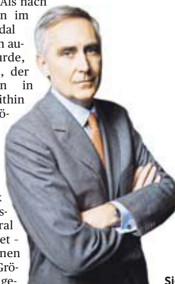
Siemens-Chef Peter Löscher

Der hatte vorher unter anderem beim US-Konzern Merck und beim Siemens-Rivalen General Electric gearbeitet - aber noch nie einen Konzern von der Größe wie Siemens ge-