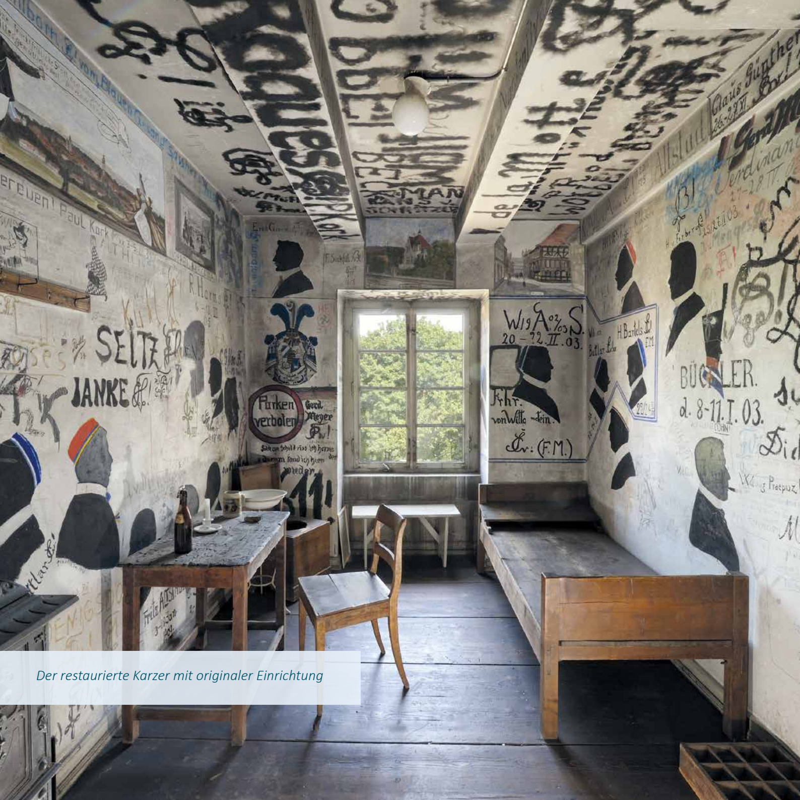
Der restaurierte Karzer mit originaler Einrichtung