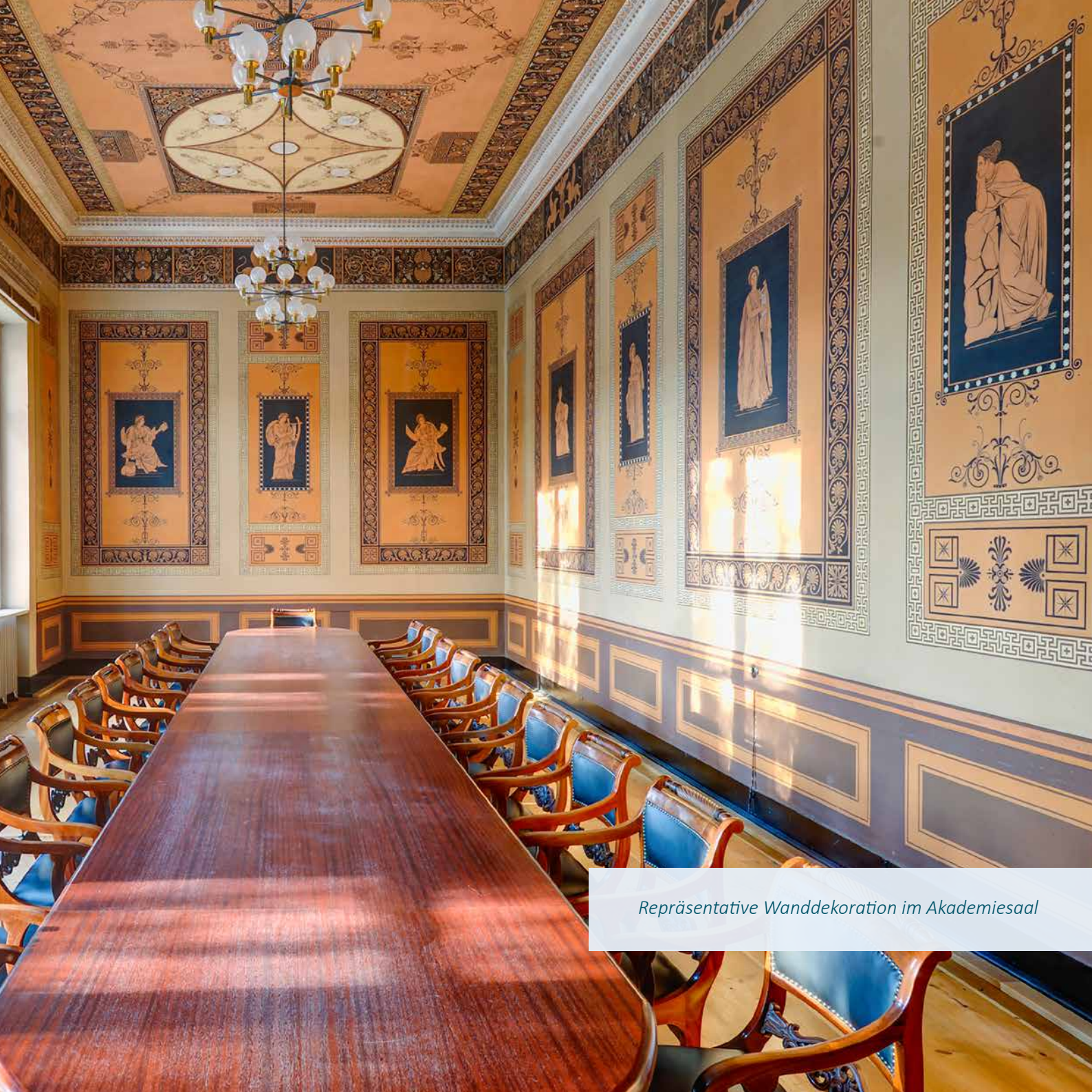
Repräsentative Wanddekoration im Akademiesaal