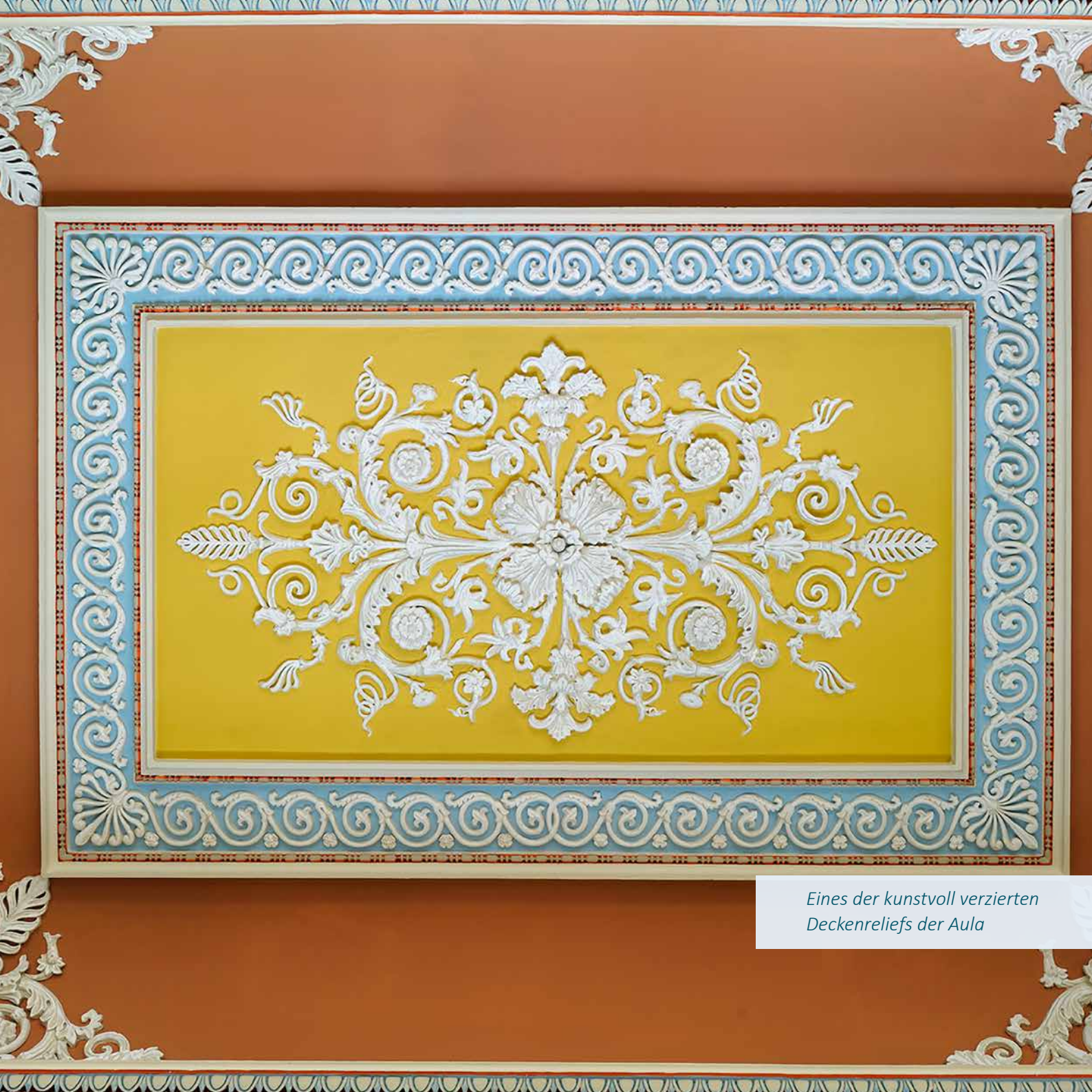
Eines der kunstvoll verzierten Deckenreliefs der Aula