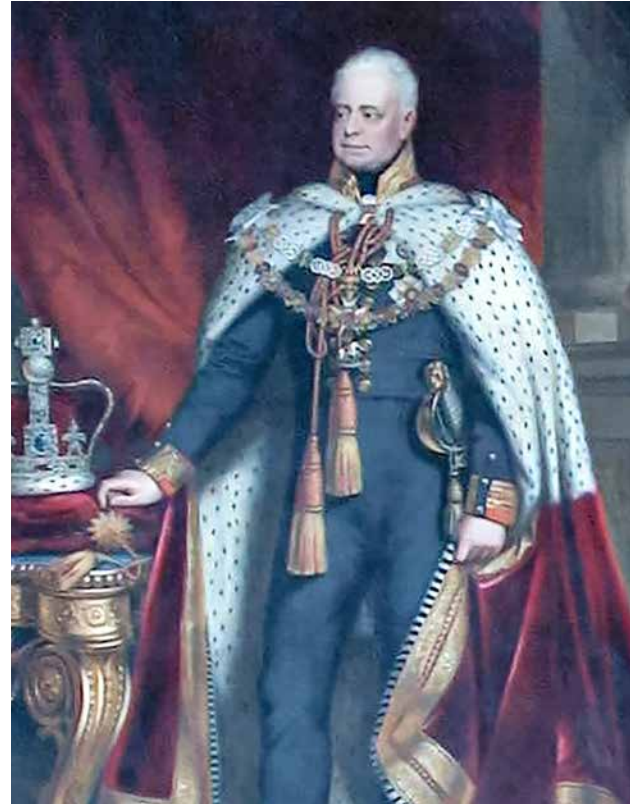
WILHELM IV. (REGENTSCHAFT 1830 BIS 1837)

Originalgemälde von Sir Thomas Lawrence.