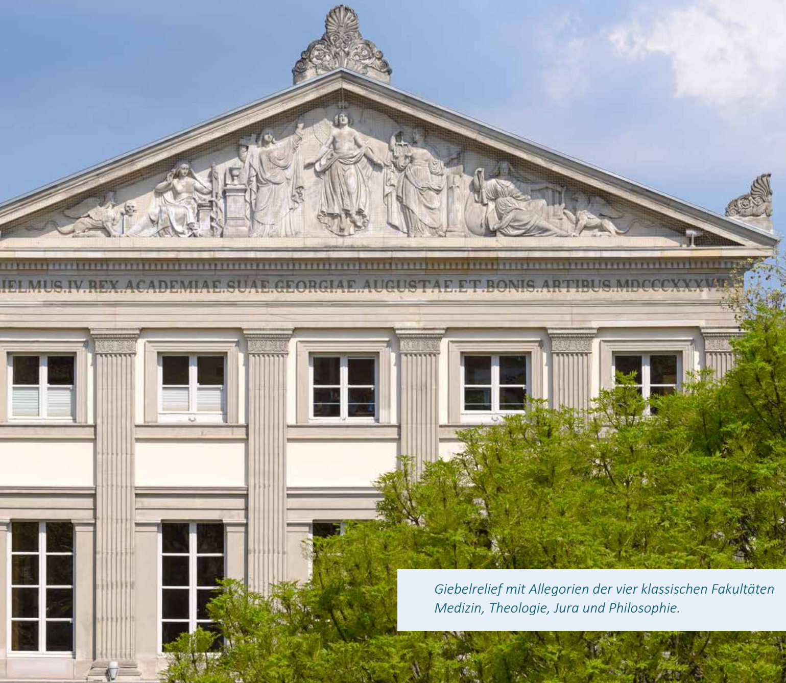
Giebelrelief mit Allegorien der vier klassischen Fakultäten Medizin, Theologie, Jura und Philosophie.