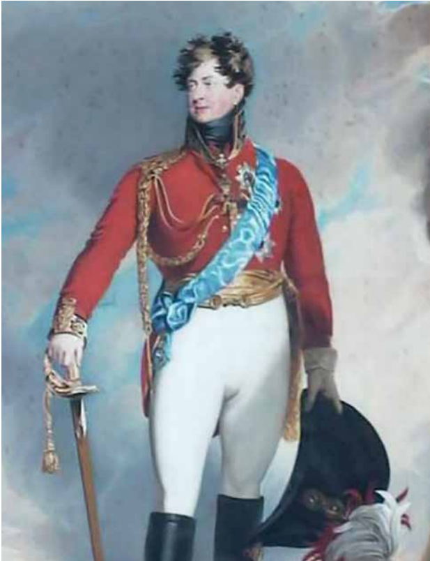
GEORG IV. (REGENTSCHAFT 1820 BIS 1830)

Georg IV. *12.8.1762, † 25.6.1830. Von 1820 bis 1830 König von Großbritannien und Irland und König von Hannover. Georg IV. stand als Lebemann im Mittelpunkt vieler Skandale und führte einen erfolglosen Scheidungsprozess (1820) gegen seine zweite Gattin, die braunschweigische Prinzessin Karoline. Für seinen Vater Georg III. übernahm er 1811 die Regentschaft, als dieser erkrankte. 1819 gab er Hannover eine Verfassung.