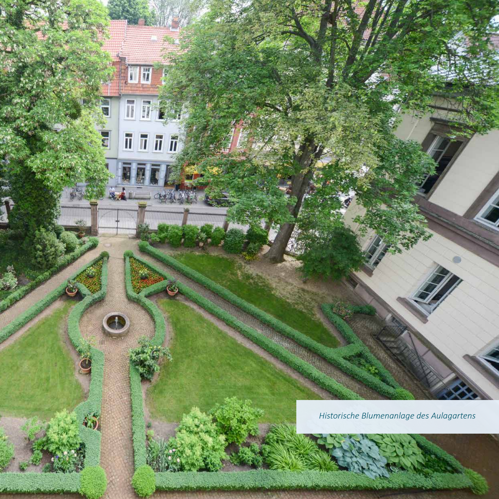
Historische Blumenanlage des Aulagartens