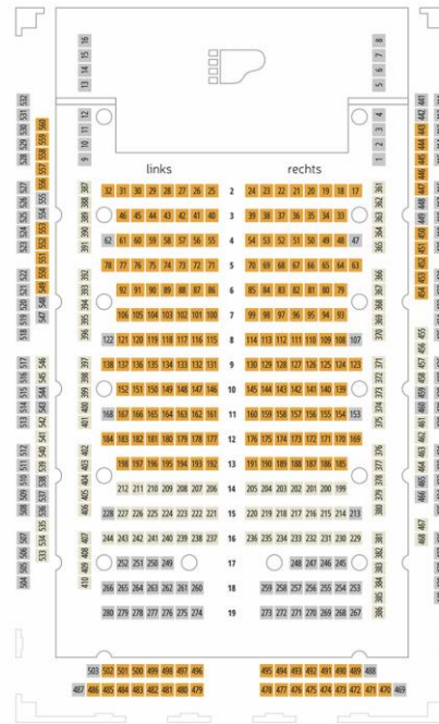
Sitzplan · Aula der Universität Am Wilhelmsplatz