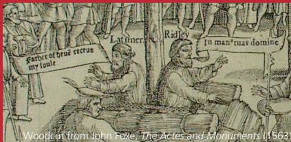
Woodcut from John Foxe, The Actes and Monuments (1563)