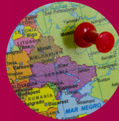
Internationales und Politik