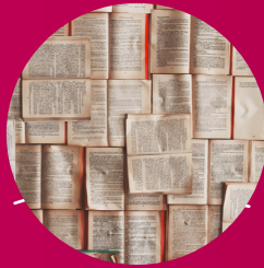
Wissenschaft und Bildung