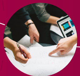
Digitalisierung und Wirtschaft