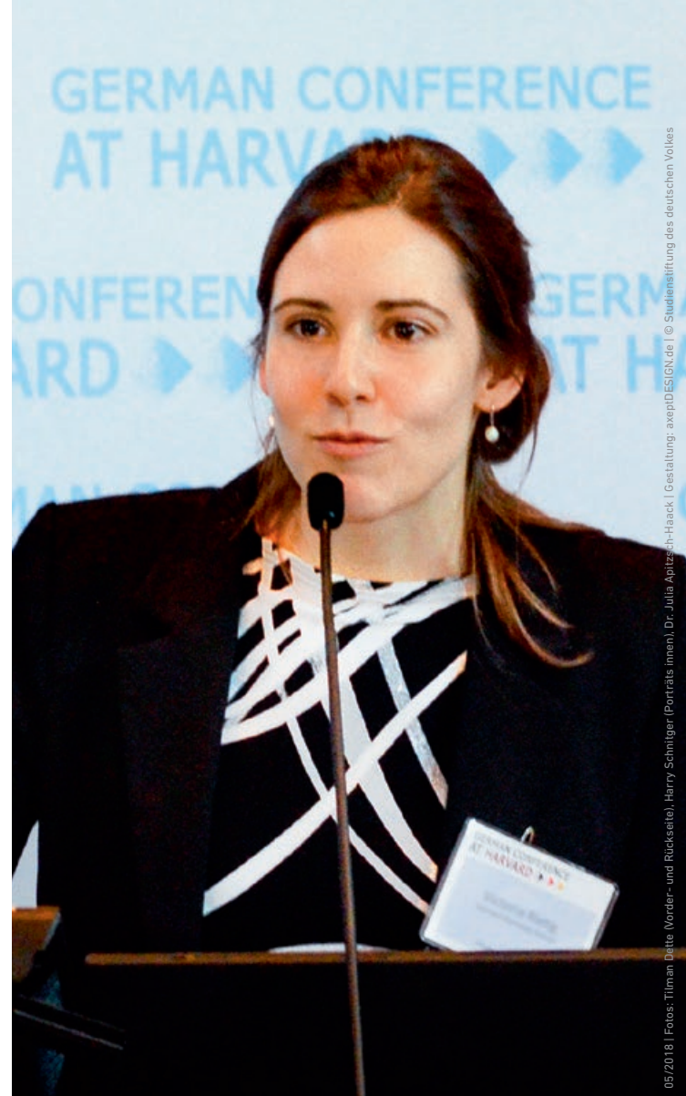
05/2018 | Gestaltung: avepDESIGN.de | © Studienstiftung des deutschen Volkes

Absolventen der Harvard Kennedy School bekommen Zugang zu einem globalen Netzwerk. Sie sind in führenden Positionen bei Regierungen, internationalen Organisationen, Think-Tanks sowie in der Wissenschaft oder Privatwirtschaft tätig. Was sie verbindet, ist das Bestreben, für den internationalen Dialog und die Veränderung der Gesellschaft einzutreten.