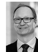
Professur für Finanzwirtschaft