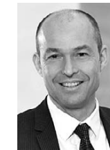
Professur für Finanzen und Controlling