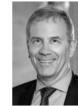
Professur für Betriebswirtschaftliche Steuerlehre