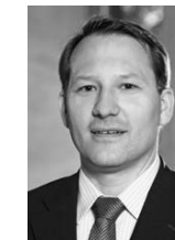
Professur für Electronic Finance und Digitale Märkte