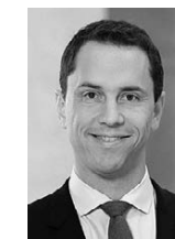
Professur für Rechnungslegung und Wirtschaftsprüfung