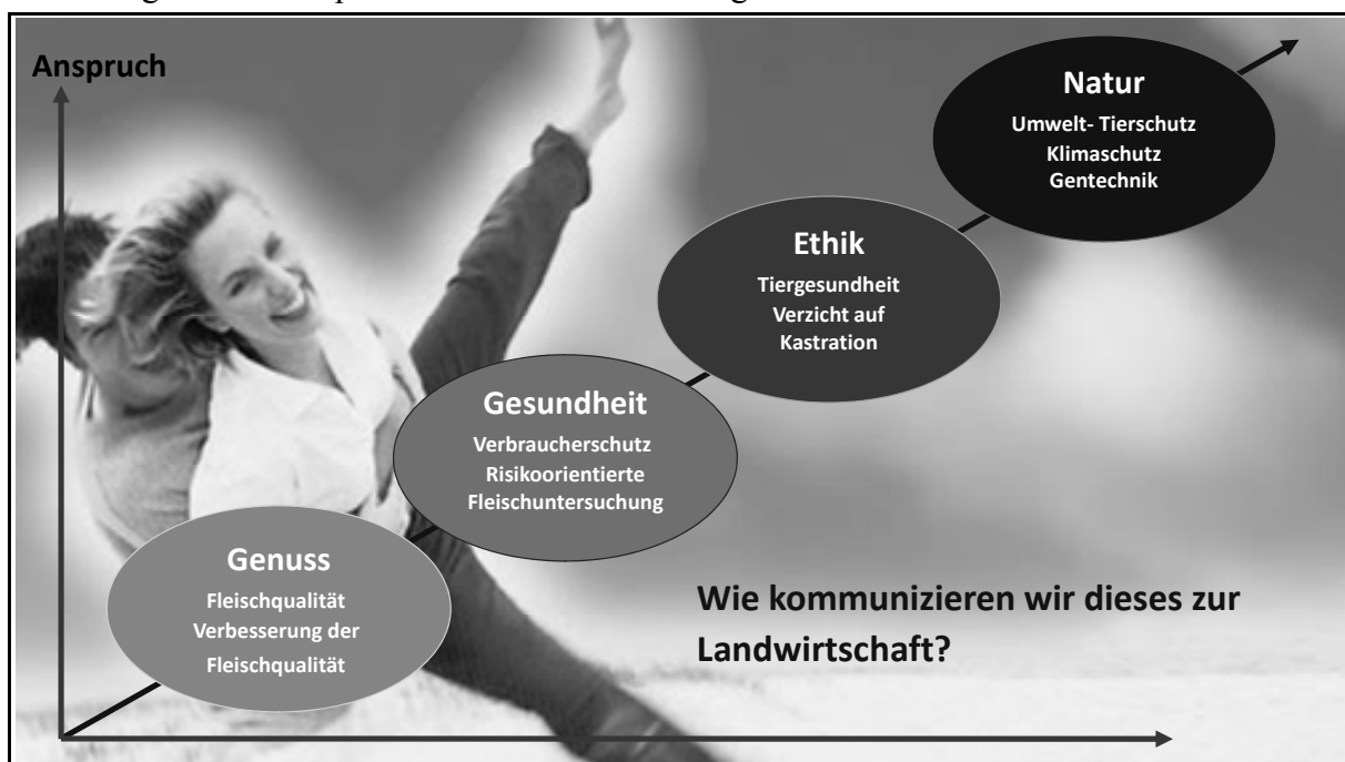
Abbildung 1: Die Ansprüche der Verbraucher steigen

Fleisch ist in der medialen Wahrnehmung des Verbrauchers zu häufig von negativen Schlagzeilen geprägt. Immer wieder zieren Headlines über Fleischskandale die Medienkommunikation. Auch die Fleischbranche hat in der medialen Wahrnehmung des Verbrauchers kein gutes Image. Schlagzeilen wie "Menschenhandel" oder "Tricks der Branche" bewegen die Verbraucher. Auf der anderen Seite steigen die Ansprüche der Verbraucher an das hochwertige Lebensmittel Fleisch (s. Abbildung 1). Neben dem Genussanspruch an beste Fleischqualität stehen hohe Anforderungen an den gesundheitlichen Verbraucherschutz. Ethische Themen des Tierschutzes werden zunehmend ebenso ausschlaggebend für die Kaufentscheidung wie Ansprüche an den Umwelt- und Klimaschutz.