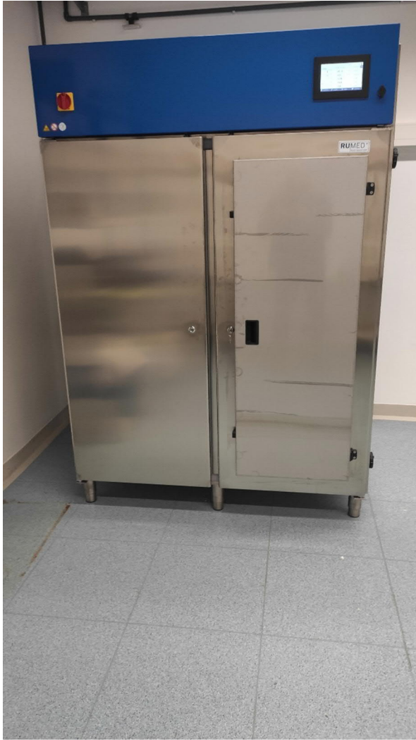
Die erste fertig installierte Kammer im Probetrieb