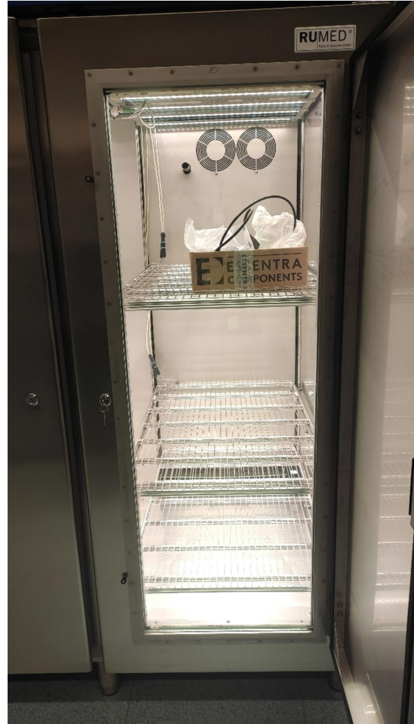
Das „Fenster“ zur Kammer ist geöffnet