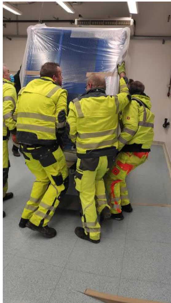
Im Raum angekommen mussten die 350 kg Kammern wieder aufgestellt werden