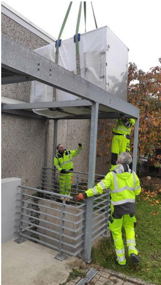
Die erste Schwierigkeit war das Einbringen der Kammern auf der Seite liegend durch das abgedeckte Vordach.